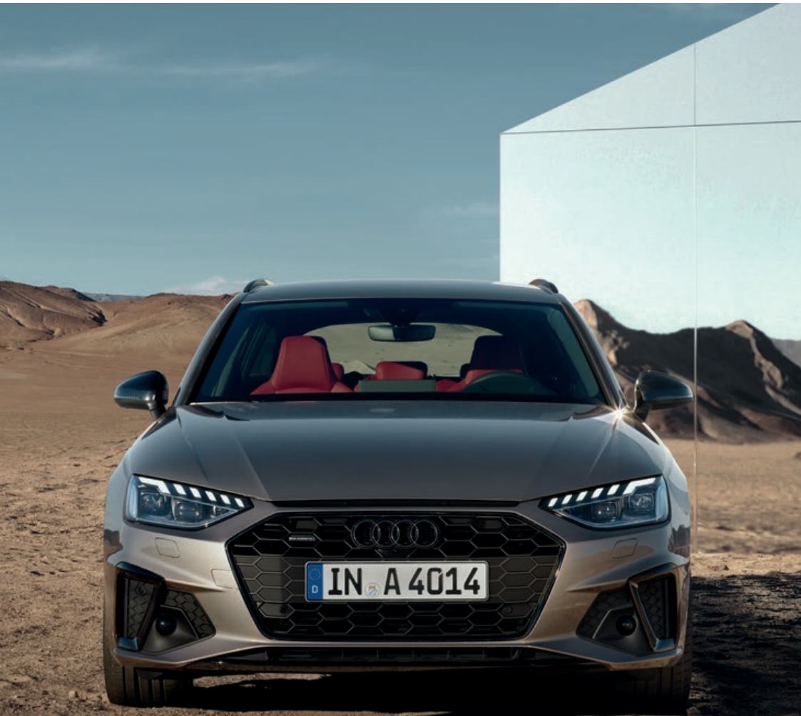
De karakteristieke Matrix-LED-koplampen met dynamische knipperlichten geven goed zicht op de weg met een helder en gelijkmatig licht.