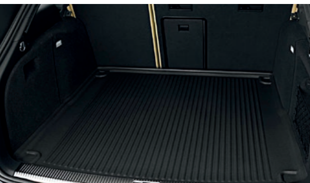
Deze praktische en robuuste kofferbakmat beschermt uw auto tegen vuil en vocht.