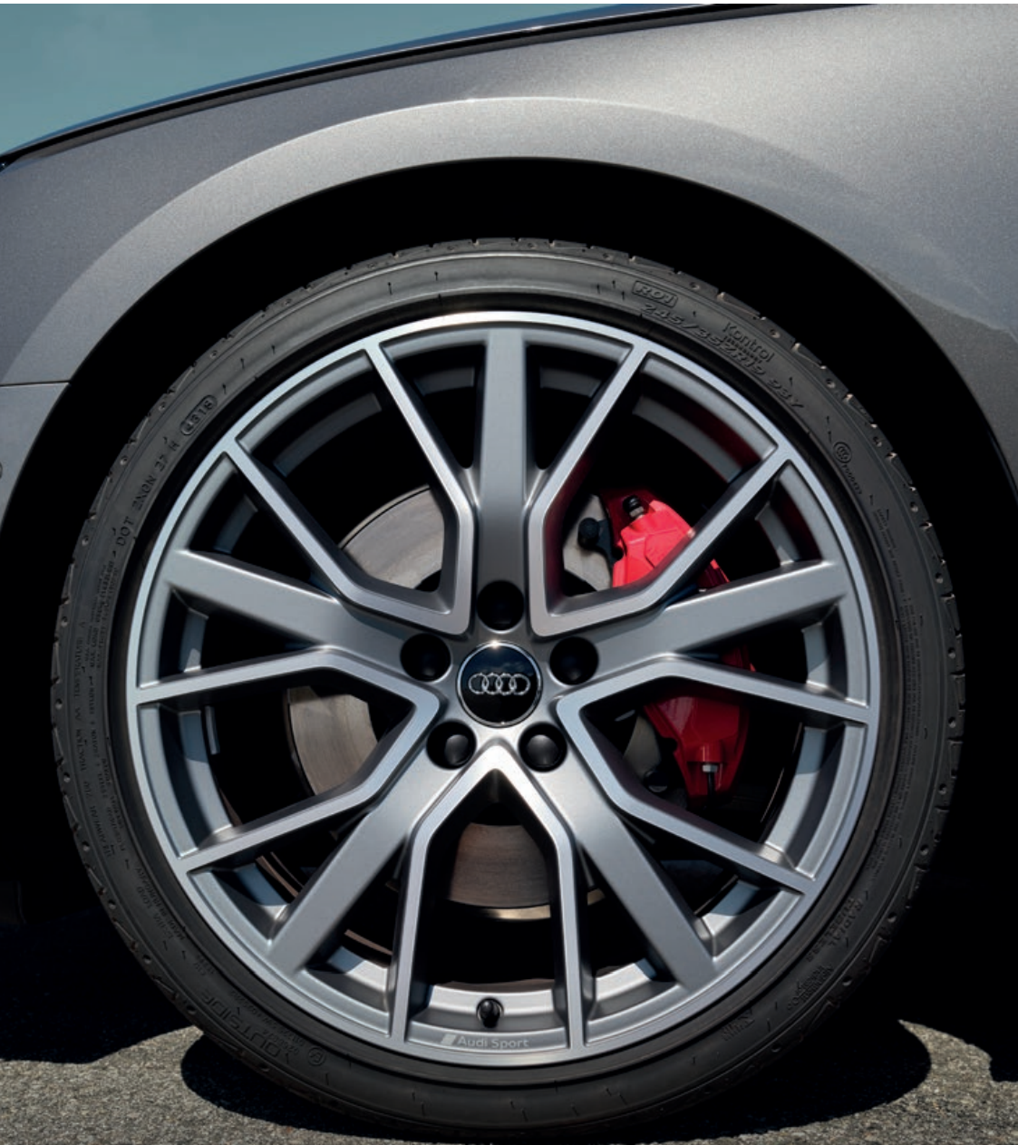
De wielkasten worden mooi gevuld door de 16 tot 19 inch grote wielen.