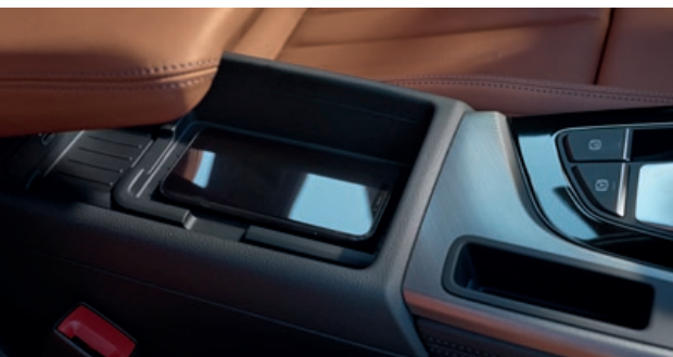
Met de optionele Audi phone box wordt uw smartphone draadloos opgeladen.