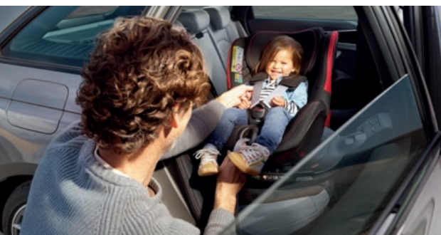
Kinderzitjes. Diverse uitvoeringen voor jonge passagiers.